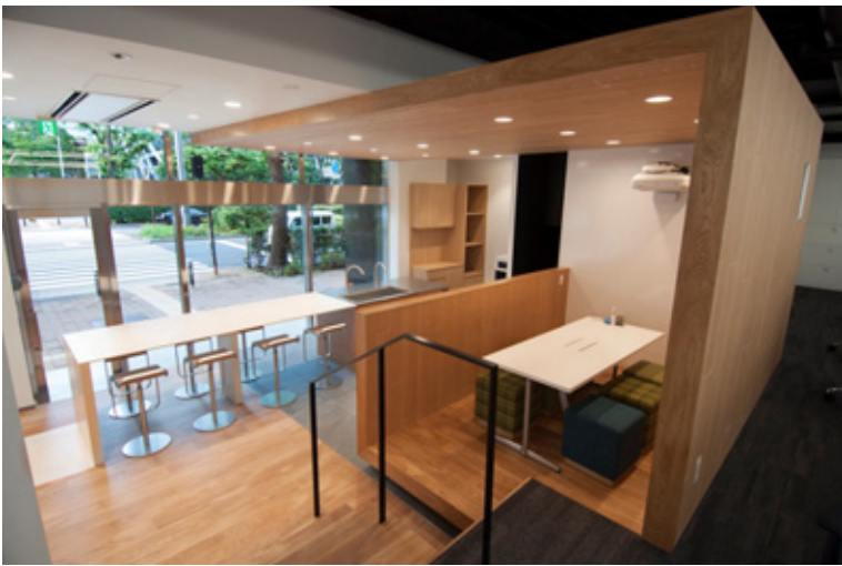
酵素玄米（有機）やコールドプレスジュースを社員に提供